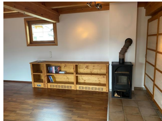
Wohnzimmer mit Ofen