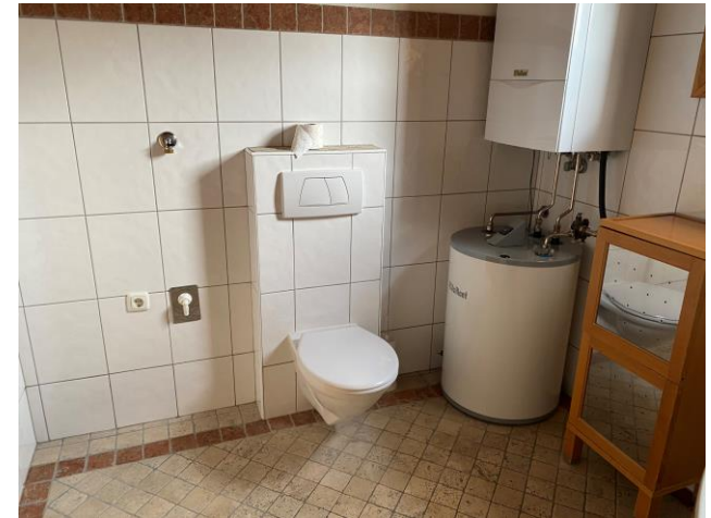
WC mit Gastherme und Boiler