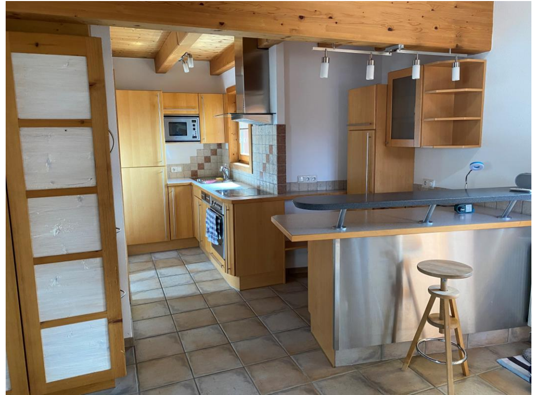
Küche mit Bar