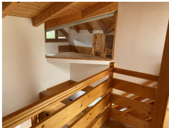
Blick ins Kinderzimmer (Trennglas)